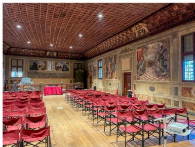
Sala della Carità, Scuola della Carità di S. Francesco Grande, Padova