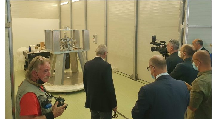
18 settembre 2021, inaugurazione Archimedes