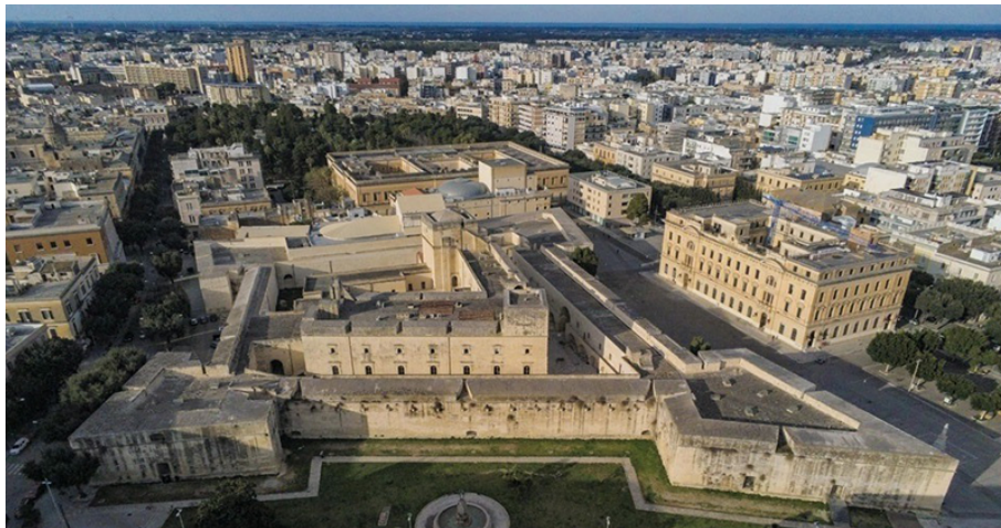
Castello Carlo V