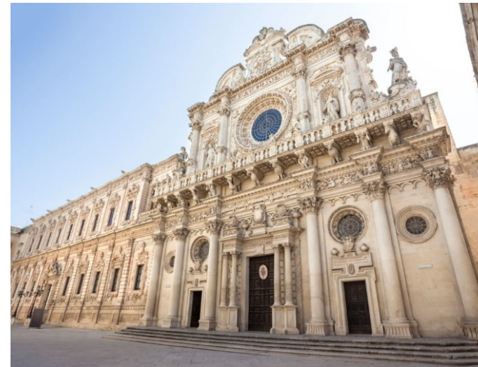
Basilica di Santa Croce