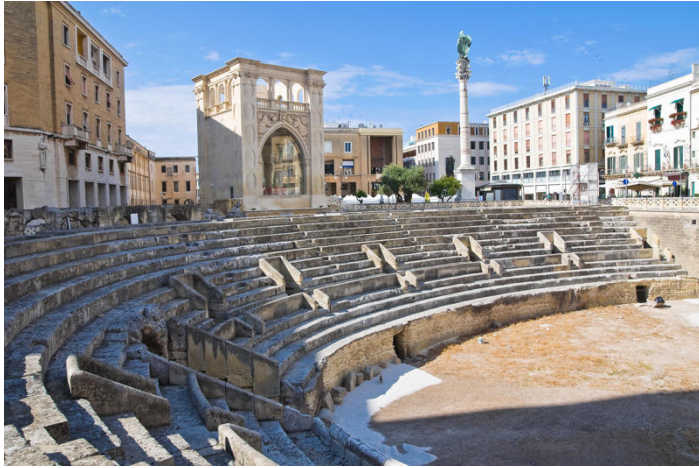
Anfiteatro romano – Piazza Sant'Oronzo