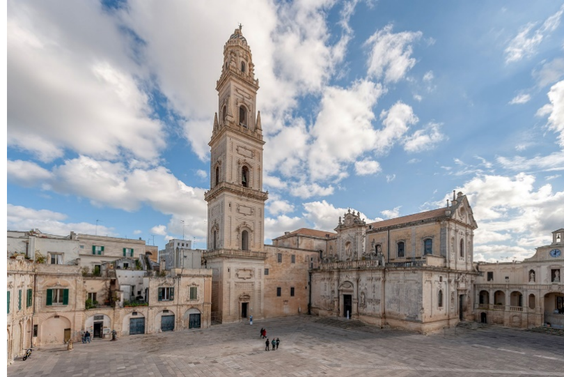
Piazza del Duomo