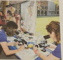
Uno degli stand della notte dei ricercatori nel cortile del Castello

state conferenze con esperti. I temi i più svariati. Dall'arte di Leonardo, passando per le scoperte biologiche fatte con le navicelle rompicapriccio. Ma anche un viaggio ipotetico da Macerata all'Albania per parlare di scoperte archeologiche. Hanno aperto le loro porte ai visitatori anche due eccellenze legate all'ateneo di Pavia: l'acceleratore di particelle del Cnao e i laboratori di Eucentre. Al Cnr, poi, si è parlato di