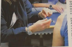
La somministrazione di un vaccino anti influenzale (archivio)

Uno degli appuntamenti più seguiti lungo tutto il corso della giornata sono stati gli stand al Castello, ma in tutto gli eventi sono stati oltre una ventina. Pro-