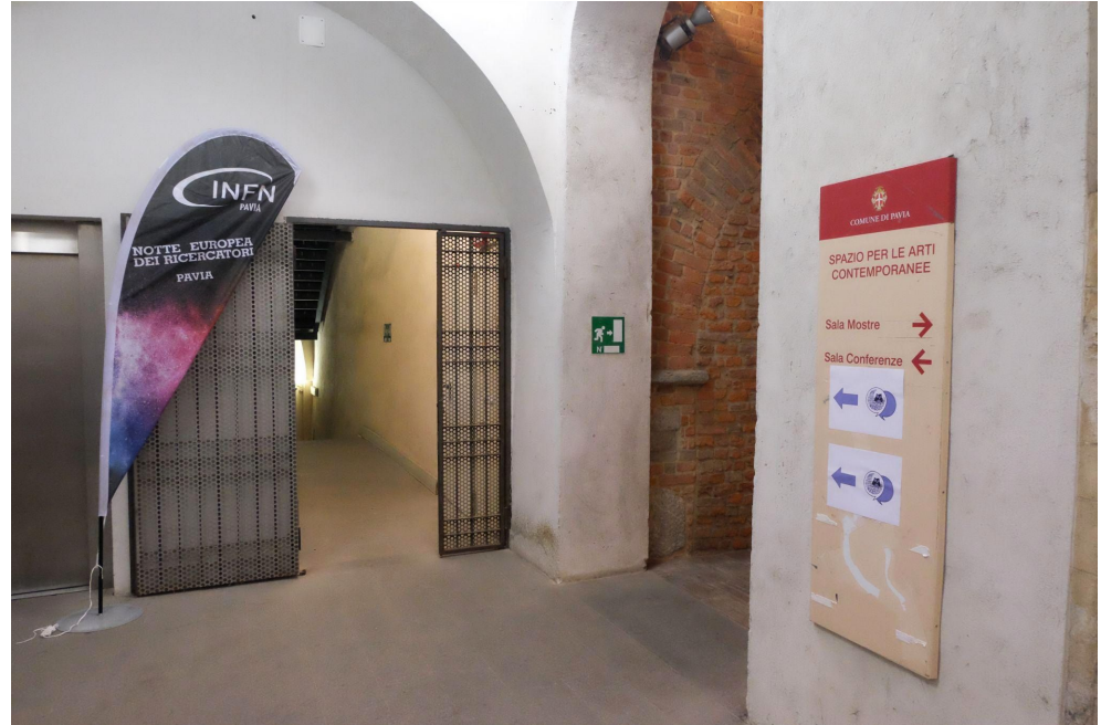
Ingresso del Palazzo del Broletto e della sala conferenze