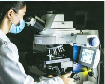
Le giornate dedicate a Ricerca e ricercatori sono state introdotte dalla Commissione Europea nel 2005