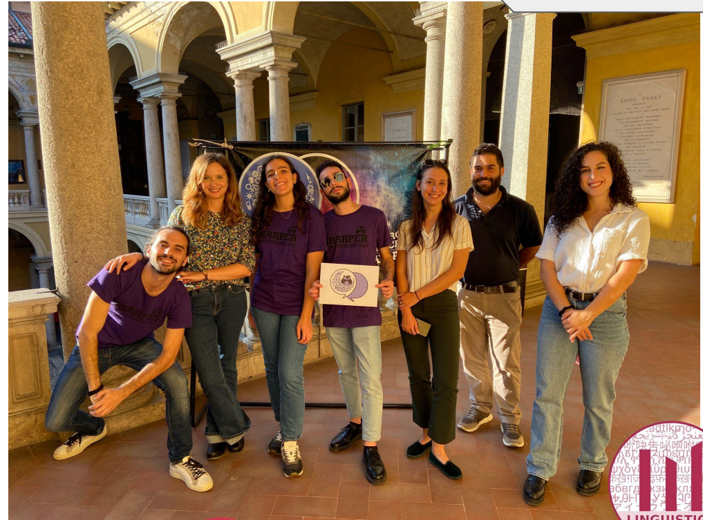
I soliti ignoti