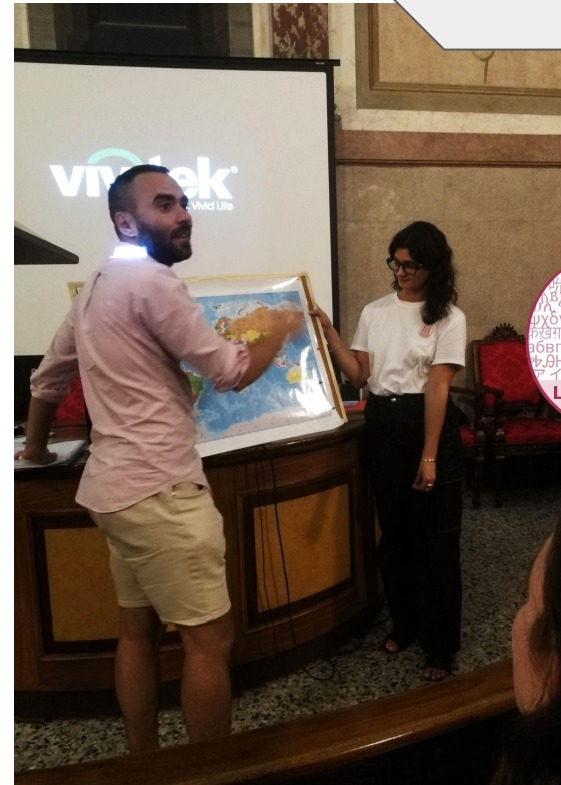
Lingue senza frontiere