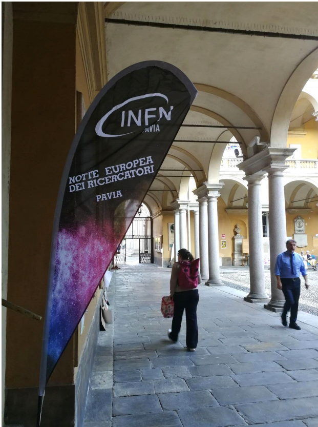
Sostenibilità e erbicidi