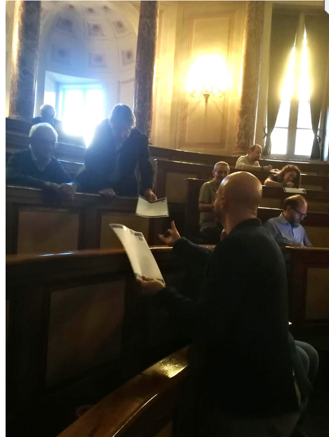
L'accento della diversità / La gioconda di Asimov