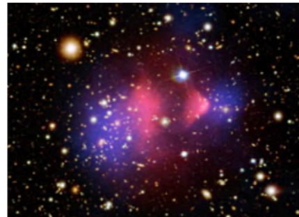
Immagine artistica che rappresenta, sovrapposta a un'immagine ottica, la distribuzione spaziale della materia ordinaria (rosa) e quella della materia oscura (blu) stimata studiando lo scontro tra due ammassi di galassie (Bullet Cluster).

L'attività di divulgazione scientifica di Dark sarà svolta sul territorio nazionale nelle varie sedi INFN partecipanti.