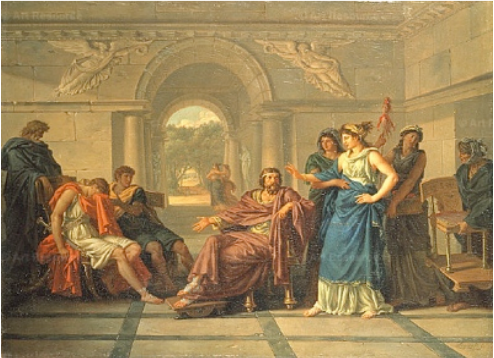
J.J. Lagrenée (1740-1821) Hermitage