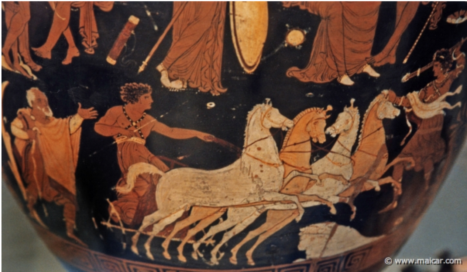
Cratere a figure rosse, 340 a.C. Puglia