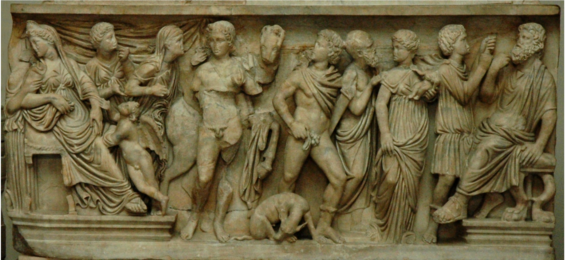
Sarcofago in marmo, III d.C., via Emilia, Toscana (Louvre)