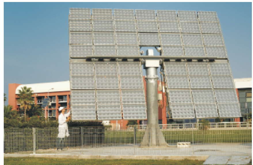
CONCENTRATORE FOTOVOLTAICO PHOCUS DA 5 KWP

aula 5 – Edificio "E. Fermi" ore 14:00 – 16:00