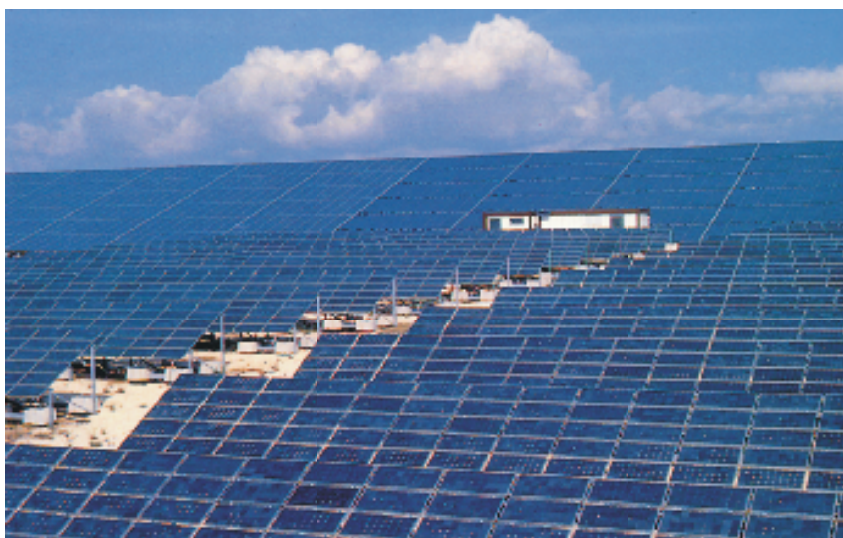
IMPIANTO FOTOVOLTAICO DELPHOS DA 600 KWP

lunedì 16 febbraio mercoledì 18 febbraio venerdì 20 febbraio